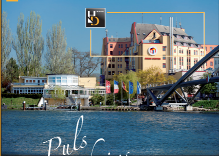
Blick vom Rhein und von der Dreiländerbrücke

Auch der Rheinpark, direkt vor der Haustür, lädt zu einem Spaziergang am Rheinufer ein. Hier befindet sich auch eine Schiffsanlegestelle der Basler Personenschiffahrt. Durch die Verbindung des Hotels mit dem Rheincenter sind diverse Einkaufsmöglichkeiten, Dienstleistungseinrichtungen, ein Kino und ein Fitnesscenter bequem zu erreichen.